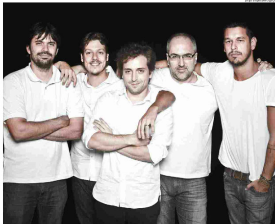
Os autores e sócios fundadores do "Porta dos Fundos": reputação obtida com exibição de vídeos traz os lucros